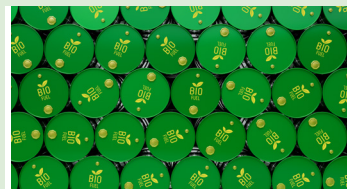
Einsatz Bio Diesel