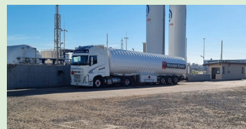
Import Bio Flüssiggas