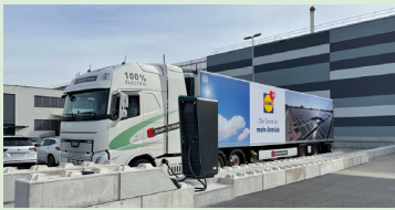
Sonne im Tank – E-LKW

Lidl Schweiz will die Zielvorgaben von «Lean & Green» mit vier Massnahmen aus den Kategorien Lager- und Transportlogistik, energieeffiziente Technologien, effizientes Energiemanagement sowie Organisations- und Verhaltensmanagement erreichen: